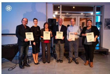
5 à 7 du port de Baie-Comeau