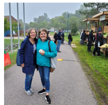
Marché public de la Manicouagan Desjardins