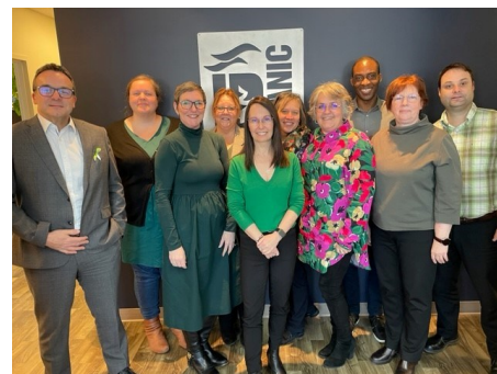
Journée de la persévérance scolaire