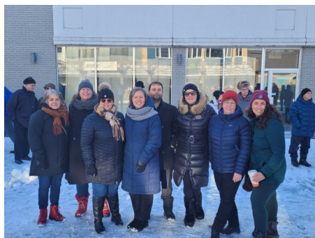
Manifestation pour le pont sur le Saguenay