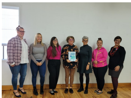
Lancement de la Politique culturelle de la MRC de Manicouagan