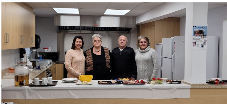
Inauguration de la nouvelle cuisine du Centre communautaire des aînés de Ragueneau