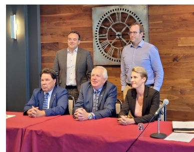
Présentation de nos priorités pour la Manicouagan